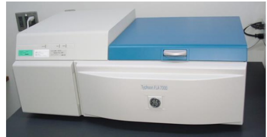
バイオイメージングアナライザー FLA7000