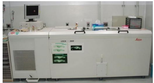
大型滑走式凍結マイクローム CM3600